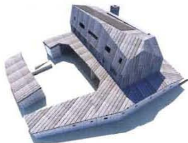
Galyatetői turistaház, látványterv.

Az állami erdőgazdaságok több mint száznegyven nagy közjóléti beruházással szolgálják mindnyájunk pihenését, a gyermekek természetbarát nevelését. Megkezdődött a több évtizedes nemtörődömség miatt elpusztult turistaház-hálózat újrakiépítése is.