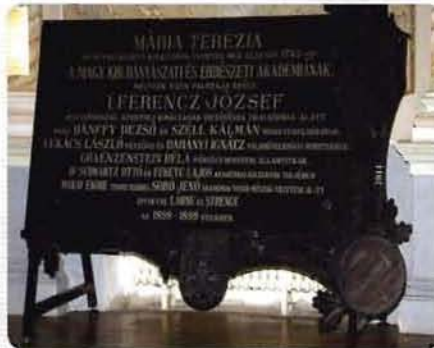
A selmecbányai akadémia erdészeti palotájának építését megőrkítő emléktáblát az enyészettől mentettük meg. Gyönyörűen felújítva ismét Selmecen van.