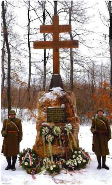
Emlékművet állítottunk a második világháború 68 éve jeltelen sírokban nyugvó magyar áldozatainak a Vértesben.