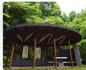
Páris-patak pihenőhely, látványterv.