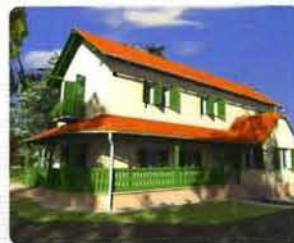
Pákozdi arborétum, látványterv.