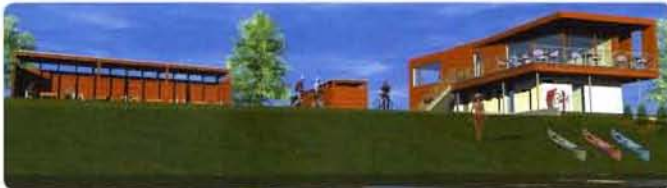
Baja, az Országos Kékkör Duna-parti pihenője, látványterv.

Az állami erdőgazdaságok több mint száznegyven nagy közjóléti beruházással szolgálják mindnyájunk pihenését, a gyermekek természetbarát nevelését. Megkezdődött a több évtizedes nemtörődömség miatt elpusztult turistaház-hálózat újrakiépítése is.