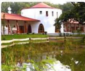
Vackor Vár Erdel Iskola.