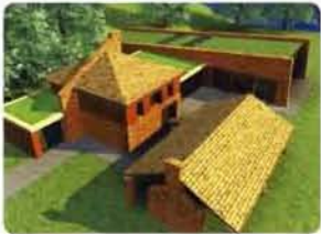
Süttő, vadászház, látványterv.