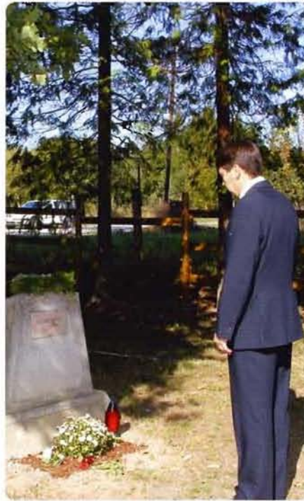
Felújítottuk az aradi vértanúk emlékparkját a Vas megyei Rátóton, amelynek eredeti tölgyfáit Deák Ferenc ültette.